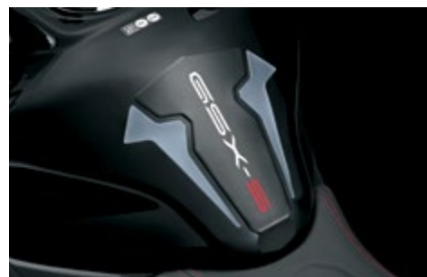
Tankpad 99180-48K11-GRY Zabezpiecza zbiornik paliwa przed uszkodzeniami. Wykonany z grubej folii, z logo "GSX-S". Komplet 3 el.