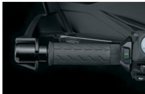
Podgrzewane manetki 57100-48822-000 Doskonale rozplanowane strefy grzania zapewniają najwyższy komfort podróży nawet w niesprzyjających warunkach. Panel sterujący do wyboru jednego z 3 trybów pracy.