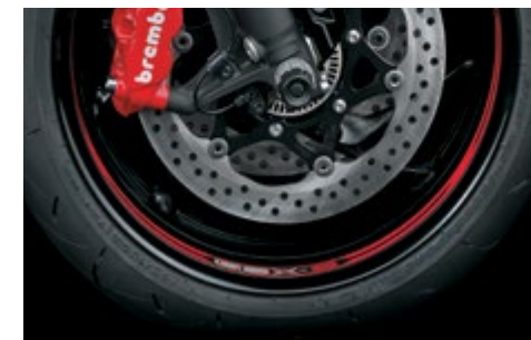
Naklejki ozdobne na obręcz koła 99182-48K11-RED Naklejki na wewnętrzną płaszczyznę obręczy. Czerwone, z logo "GSX-S". Komplet 6 el., na jedno koło.