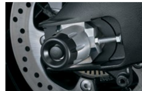
Ślizgi ochronne osi tylnej 64790-48810-000 Doskonale chronią wrażliwe elementy motocykla. Komplet 2 szt., na lewą i prawą stronę.