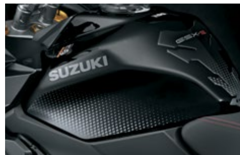
Folie ochronne na zbiornik paliwa 99181-48K11-BLK Zabezpieczają zbiornik paliwa przed uszkodzeniami na wysokości kolan. Czarna folia z motywem rombu, komplet 2 szt.