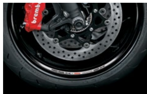
Naklejki ozdobne na obręcz koła 99182-48K20-SGX Naklejki na wewnętrzną płaszczyznę obręczy. Białe z czarnym motywem rombu, z logo "GSX-S1000GX". Komplet 6 el., na jedno koło.