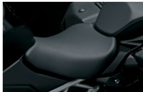
Obniżone siedzisko 45100-48K10-B8Q 15 mm niższe niż standardowe siedzisko (tylko fotel kierowcy).