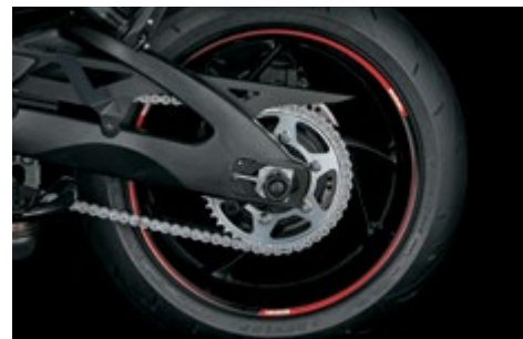
Naklejki ozdobne na obręcz koła 99183-00A11-RD1 Naklejki na zewnętrzny rant obręczy. Czerwono-czarne z białym logo "SUZUKI". Komplet 6 el., na jedno koło.