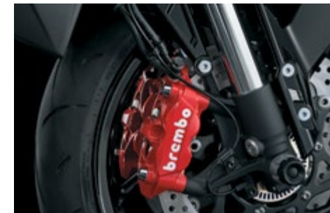
Zaciski hamulcowe Brembo 59100-17800-000 Wyczynowe zaciski hamulcowe BREMBO na przednie koło. Zapewniają precyzyjną kontrolę oraz płynność hamowania. Czerwone, komplet 2 szt. Zestaw nie zawiera klocków hamulcowych oraz drobnych elementów instalacyjnych (np. wkrętów i podkładek).