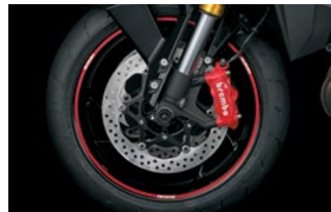
Naklejki ozdobne na obręcz koła 99183-00A21-RD1 Naklejki na zewnętrzny rant obręczy. Czerwone z białym logo "SUZUKI". Komplet 6 el., na jedno koło.