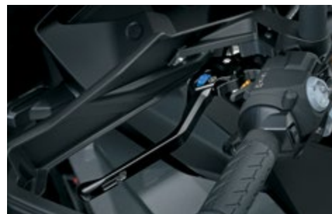
Dźwignia sprzęgła 57600-48810-000 Sportowe dźwignie, precyzyjnie wykonane z najwyższej jakości aluminium. Czarne, anodowane. Z logo "SUZUKI". W zestawie regulator dźwigni, w dwóch kolorach do wyboru - czerwony / niebieski.