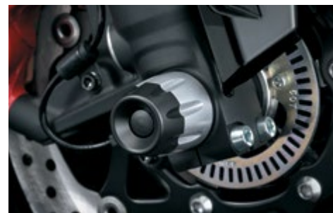
Ślizgi ochronne osi przedniej 54790-48810-000 Doskonale chronią wrażliwe elementy motocykla. Komplet 2 szt., na lewą i prawą stronę.