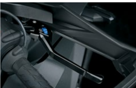
Dźwignia hamulca 57400-48810-000 Sportowe dźwignie, precyzyjnie wykonane z najwyższej jakości aluminium. Czarne, anodowane. Z logo "SUZUKI". W zestawie regulator dźwigni, w dwóch kolorach do wyboru - czerwony / niebieski.