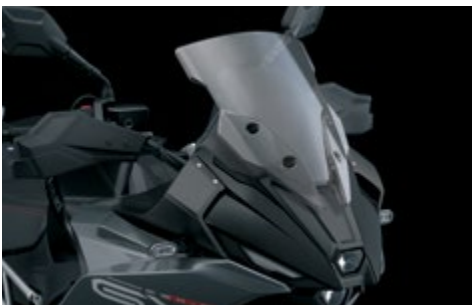
Szyba sportowa (przeciwniona) 94601-48820-000 Akcesoryjna szyba czołowa, przeciwniona i niższa o 55 mm. Niezbędna dla poszukiwaczy sportowych emocji.