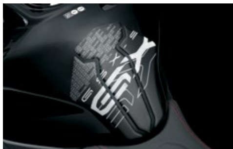
Tankpad 99180-48K30-SGX Zabezpiecza zbiornik paliwa przed uszkodzeniami. Wykonany z czarnej folii z motywem "GX", z logo "GSX-S GX". Komplet 3 el.