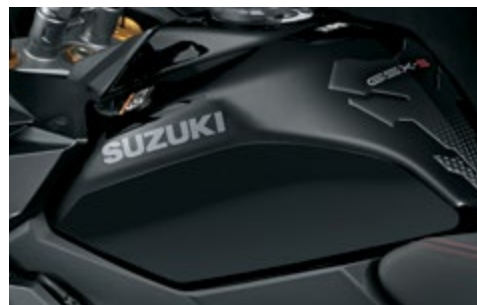
Folie ochronne na zbiornik paliwa 99181-48K01-000 Zabezpieczają zbiornik paliwa przed uszkodzeniami na wysokości kolan. Przezroczysta folia, komplet 2 szt.