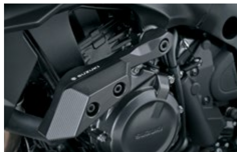
Ślizgacze ramy 41900-48810-000 Ograniczają ryzyko uszkodzenia motocykla. Komplet 2 szt., na lewą i prawą stronę.