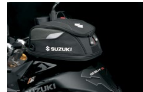
Sakwa na zbiornik paliwa (mała) 99143-00A11-000 Wykonana z wytrzymałego nylonu z odblaskową lamówką. Pojemność od 5 do 9 l. W zestawie osłona przeciwdeszczowa i pasek na ramię. Maksymalne obciążenie 2,5 kg; prędkość max. 130 km/h. Do montażu wymagany pierścień mocujący (nr kat. 44200-25810-000).