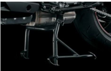
Podnóżek centralny 42100-48830-000 Zapewnia bezpieczne i stabilne parkowanie motocykla oraz ułatwia codzienną obsługę.