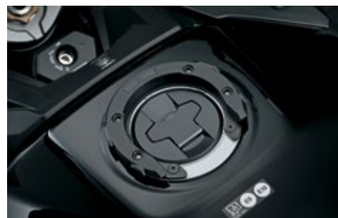
Pierścień mocowania sakwy 44200-25810-000 Wymagany do montażu sakwy na zbiornik paliwa.