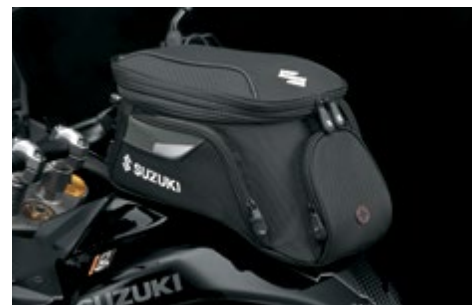
Sakwa na zbiornik paliwa (duża) 99143-00A01-000 Wykonana z wytrzymałego nylonu z odblaskową lamówką. Pojemność od 11 do 15 l. W zestawie osłona przeciwdeszczowa i pasek na ramię. Maksymalne obciążenie 2,5 kg; prędkość max. 130 km/h. Do montażu wymagany pierścień mocujący (nr kat. 44200-25810-000).