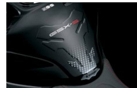
Tankpad 99180-48K21-BLK Zabezpiecza zbiornik paliwa przed uszkodzeniami. Wykonany z czarnej folii z motywem rombu, z logo "SUZUKI GSX-S".